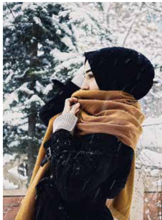
Wie gewinnen Bergbahnen neue Gäste mit Migrationshintergrund?

Es könnten, um auf eine ganzheitliche Ansprache zu setzen, kulturelle Angebote mit Skisport kombiniert werden. Ein Beispiel wären „Türkische Wintertage“, wo türkische Sänger auftreten und kulinarische Highlights aus der Türkei angeboten werden. Solche Events schaffen Bezug zu den Ursprüngen der Zielgruppe und machen den Skiurlaub zu einem Erlebnis, das über das Skifahren hinausgeht. Kombiniert könnten diese „Wintertage“ mit niederschweligen Angeboten werden, etwa speziell auf Anfänger ausgerichtete Skikurse oder Familienangebote. Solche