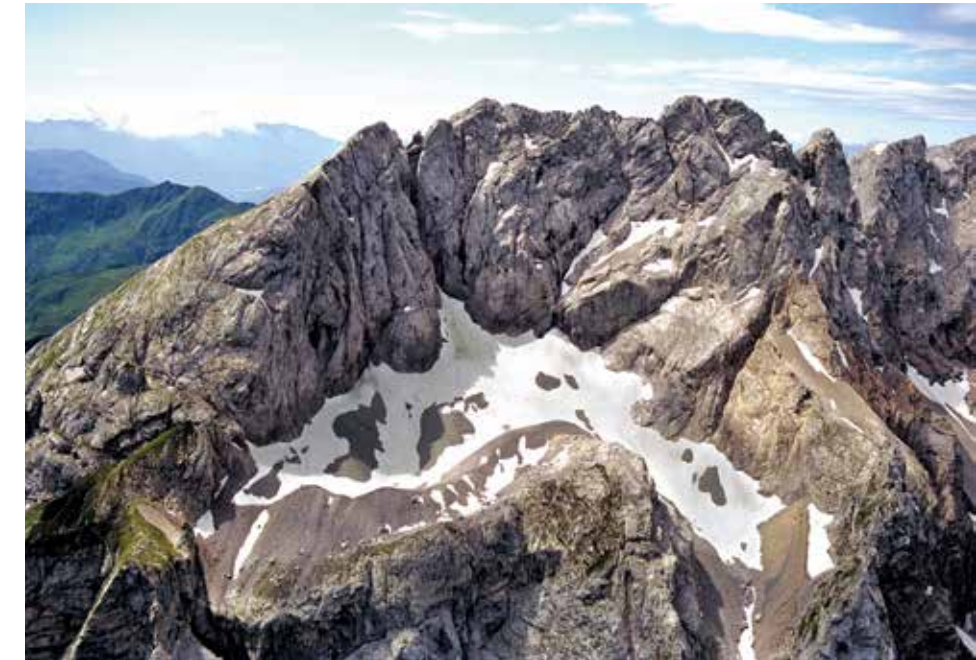
Der Eiskargletscher umrahmt von der Kellerwand mit Kollinkofel (links) und den Kellerspitzen (rechts).

Dass kaum wer je im Eiskar war, liegt an den beiden einzigen Varianten, dorthin zu gelangen. Nur passionierte, ortskundige Kletterer steigen von der Oberen Valentinalm hinauf zum Eiskar. Und vom Plöckenpass aus enden markierte Steige über italienisches Gebiet auf der Grünen Schneid. Weiter muss man ohne Weg in schwierigem alpinem Gelände. Ein nur mit detaillierter Ortskenntnis ratsames Unterfangen.