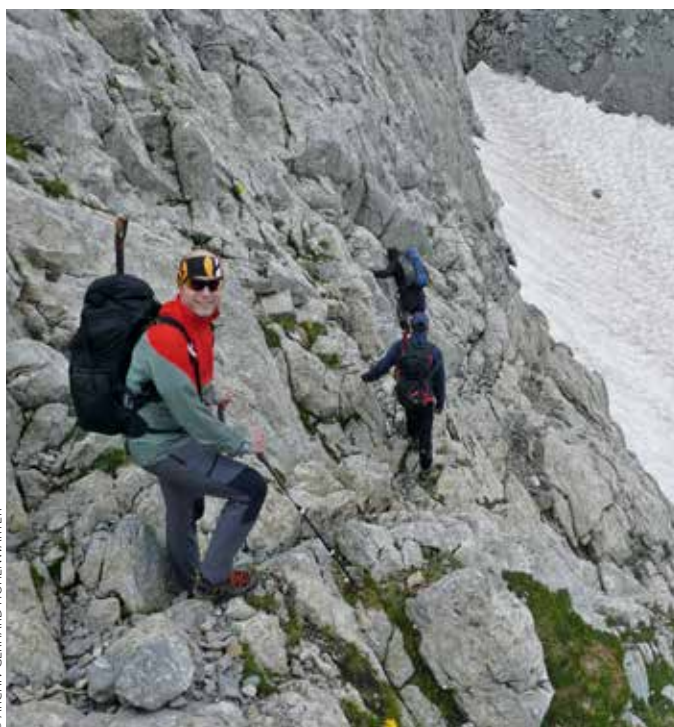
Die letzten Meter des weglosen Zustiegs zum Eiskargletscher